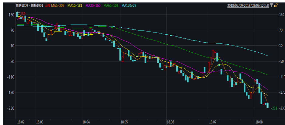
图 1: 郑糖 9-1 价差