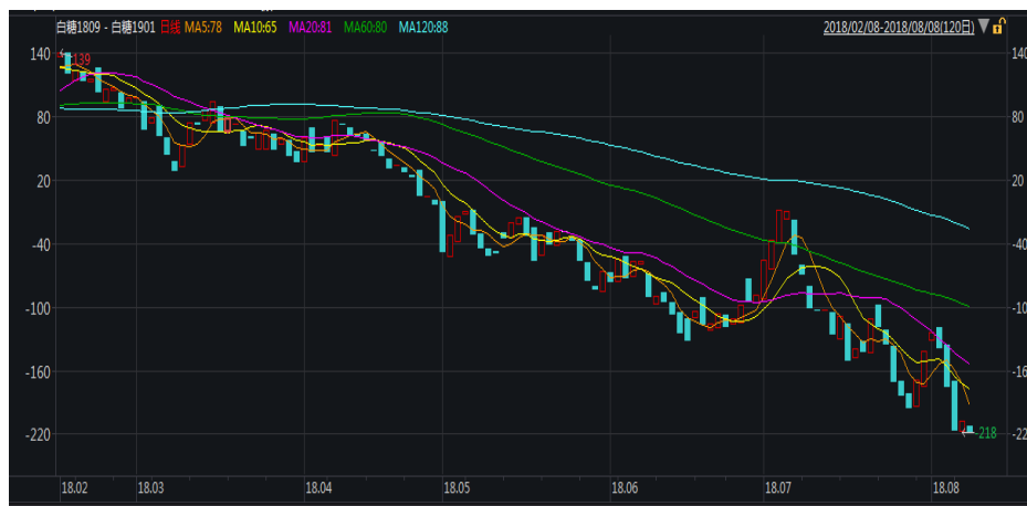
图 1: 郑糖 9-1 价差