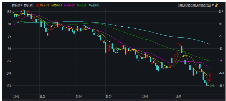
图 1: 郑糖 9-1 价差