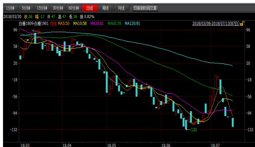
图 1：郑糖 9-1 价差