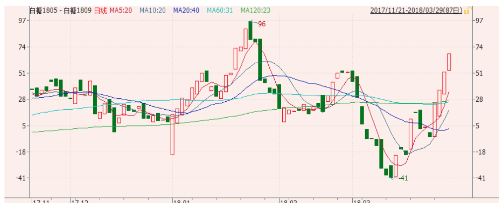
图 2: 郑糖 5-9 价差