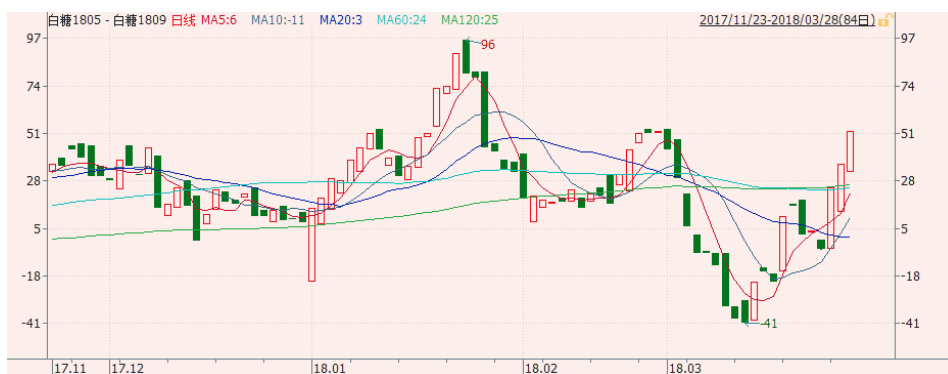
图 2: 郑糖 5-9 价差