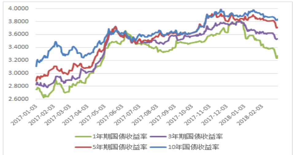
图 2：关键期限国债收益率