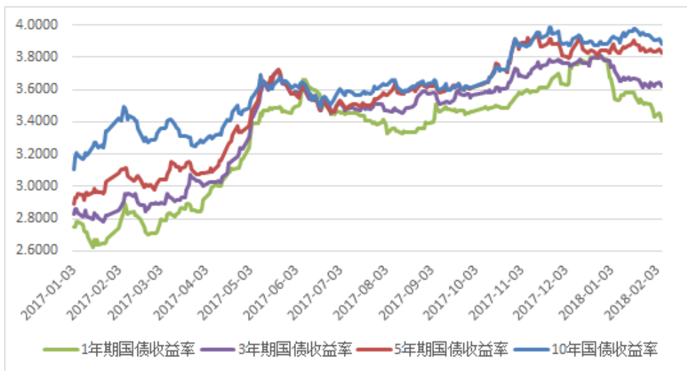
图 2：关键期限国债收益率