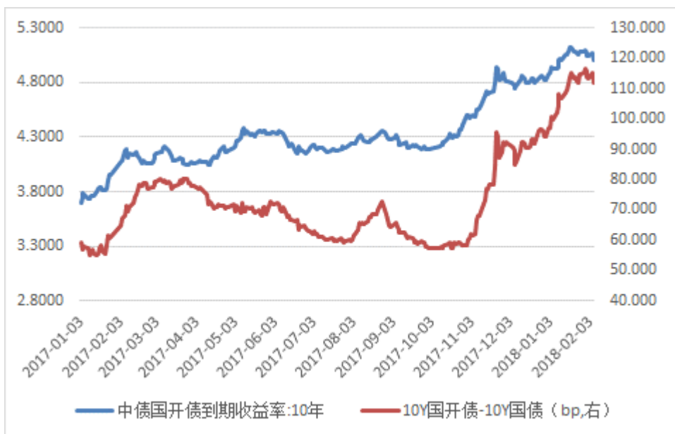
图 2：10 年期国开债收益率和国开国债利差

国债现券方面，1Y 期国债收益率变动-4.26bp 至 3.4088%，3Y 国债收益率变动-1.93bp 至 3.6236%，5Y 期国债收益率变动-2.54bp 至 3.8246%，10Y 期国债收益率变动-3.42bp 至 3.8825%。