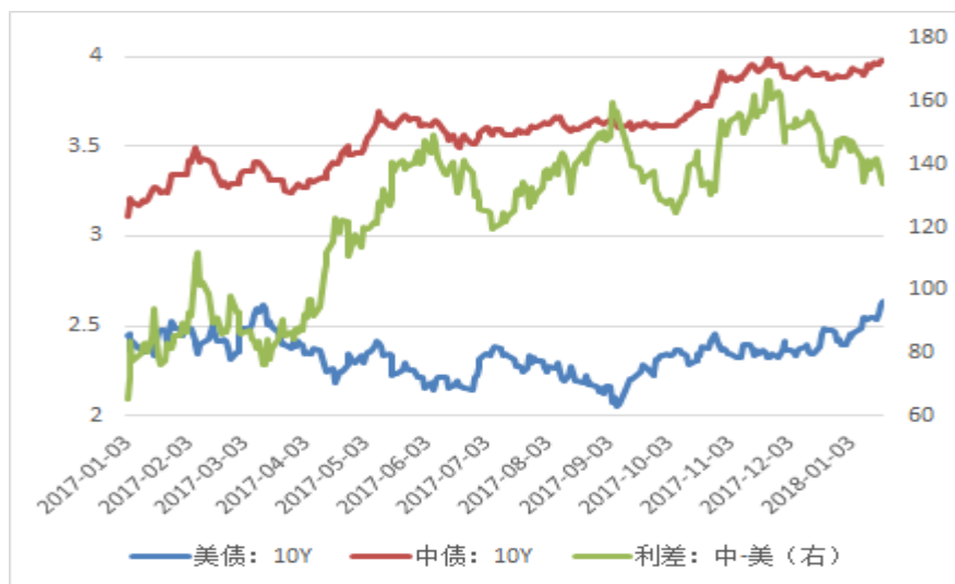
图 3: 美债收益率和中美利差