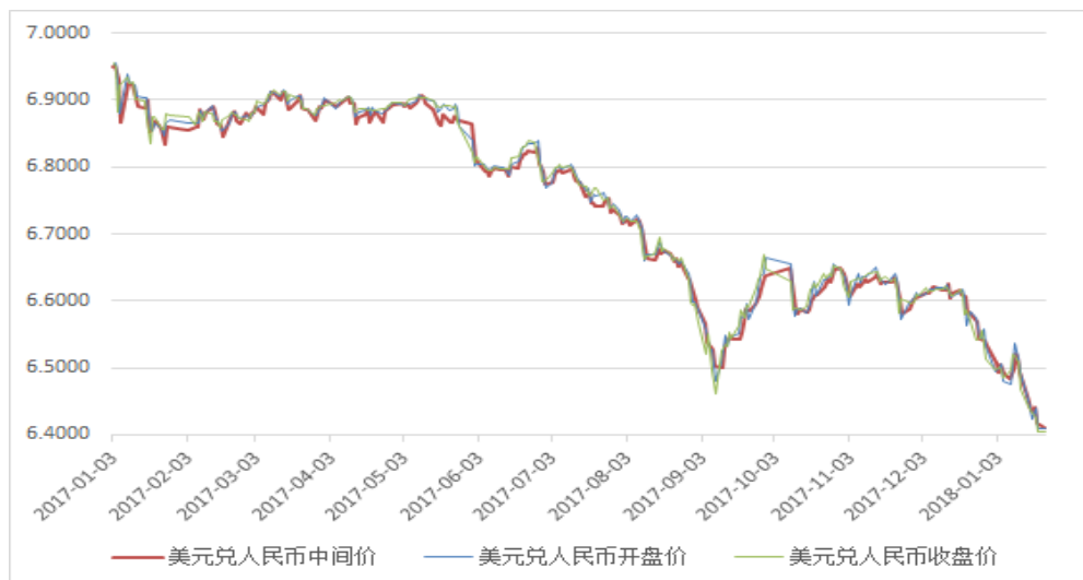
图 4: 人民币汇率

美元兑人民币中间价变动-0.57bp 至 6.4112, 美元兑人民币收盘价变动-0.04 至 6.4036。