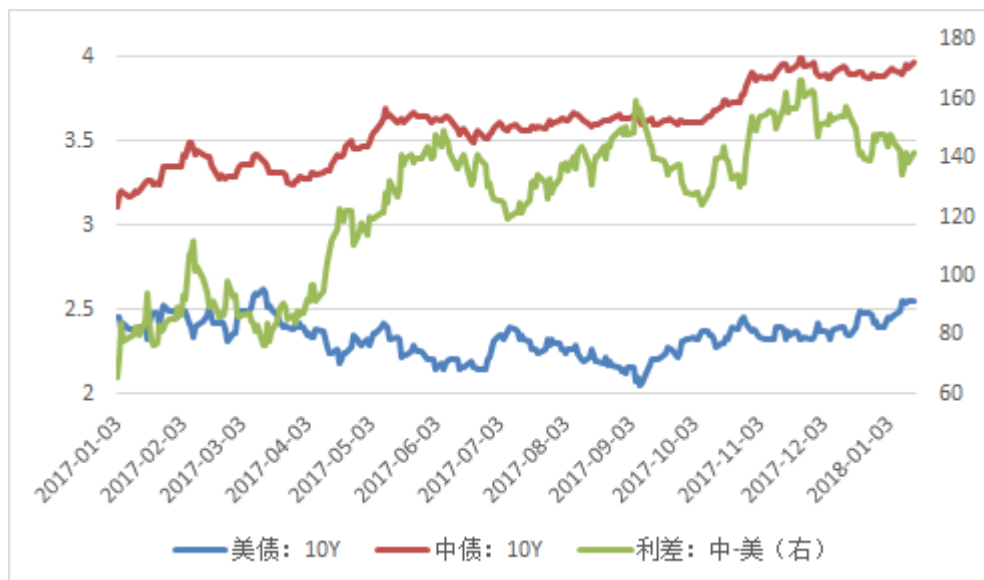
图 3：美债收益率和中美利差

美国 10 年期国债收益率变动-1.1bp 至 2.539%，中美利差变动 0.56bp 至 142.06bp。