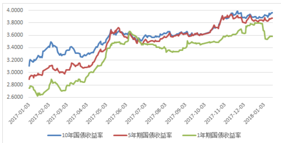
图 2: 关键期限国债收益率

从主力合约来看, 主力 TF1803 合约结算价为 95.975 元, 成交 6747 手, 持仓 39951 手, 较前一交易日减仓 893 手; 主力 T1803 合约结算价为 91.965 元, 成交 25907 手, 持仓 59522 手, 较前一结算日减仓 513 手。