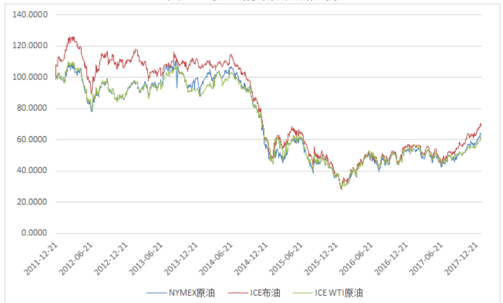
图 8：原油期货活跃成交价

上海猪肉全国平均价变动 0 元至 25.35 元,猪肉批发价变动 0.00 元至 21.13 元。