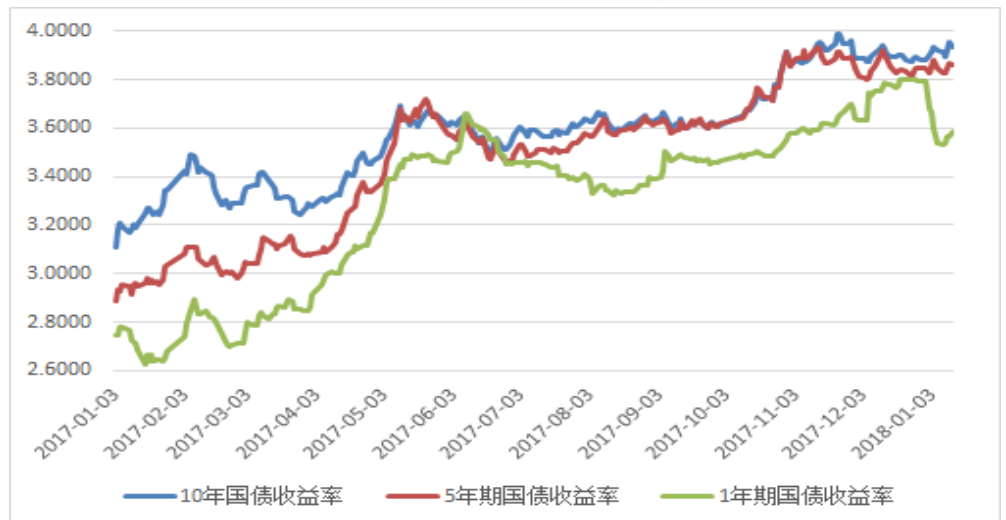
图 2: 关键期限国债收益率

从主力合约来看, 主力 TF1803 合约结算价为 96.145 元, 成交 6210 手, 持仓 40470 手, 较前一交易日减仓 1169 手; 主力 T1803 合约结算价为 92.28 元, 成交 22852 手, 持仓 59456 手, 较前一结算日减仓 3291 手。