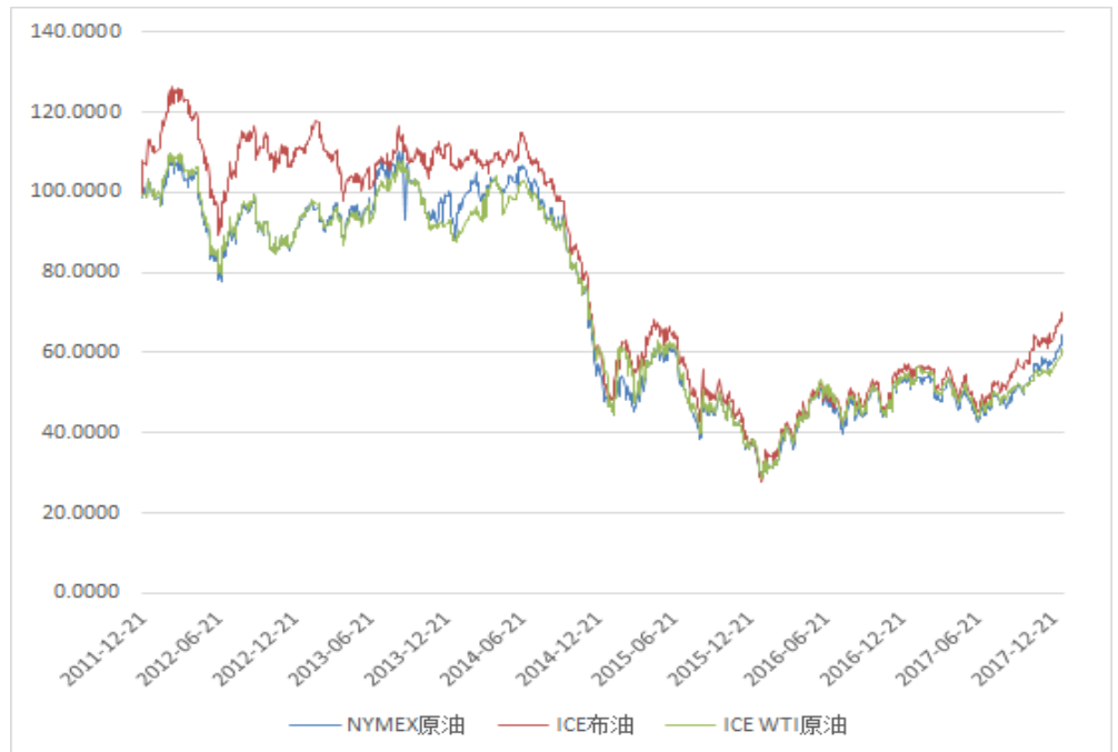
图 8：原油期货活跃成交价

上海猪肉全国平均价变动 0 元至 25.35 元,猪肉批发价变动 0.09 元至 21.13 元。