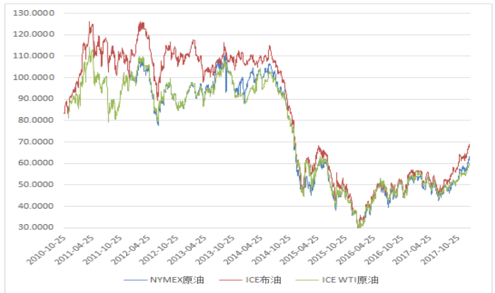
图 7：原油期货活跃成交价