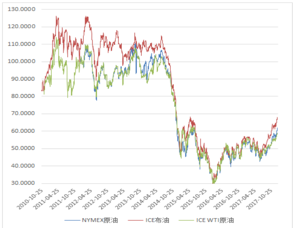
图 6：原油期货活跃成交价