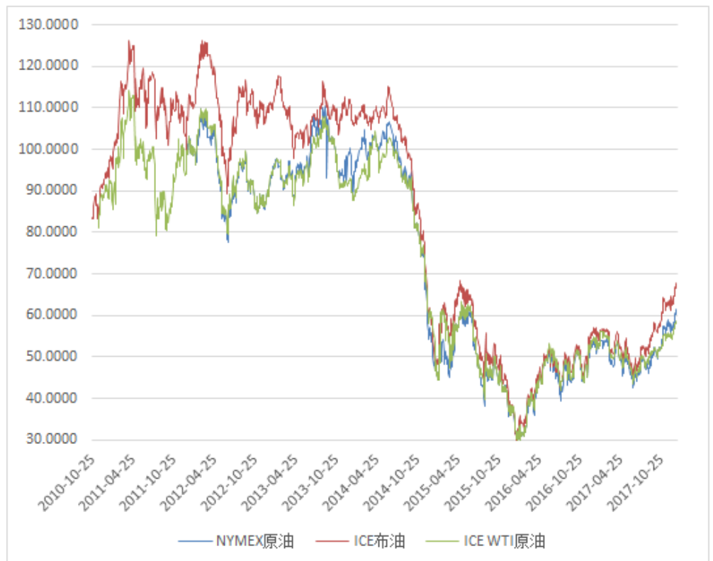
图 6: 原油期货活跃成交价