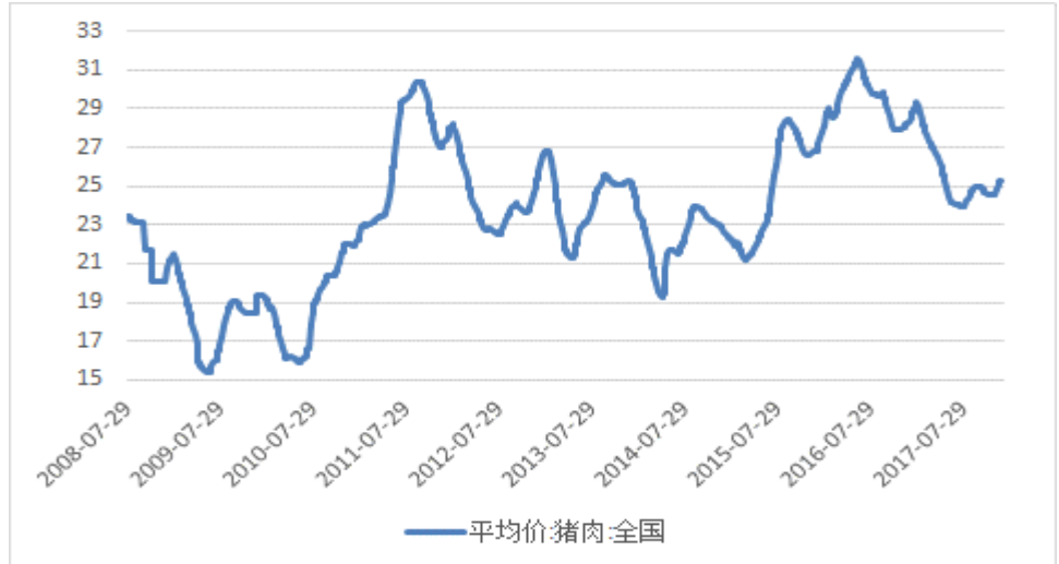
图 5: 全国猪肉平均价