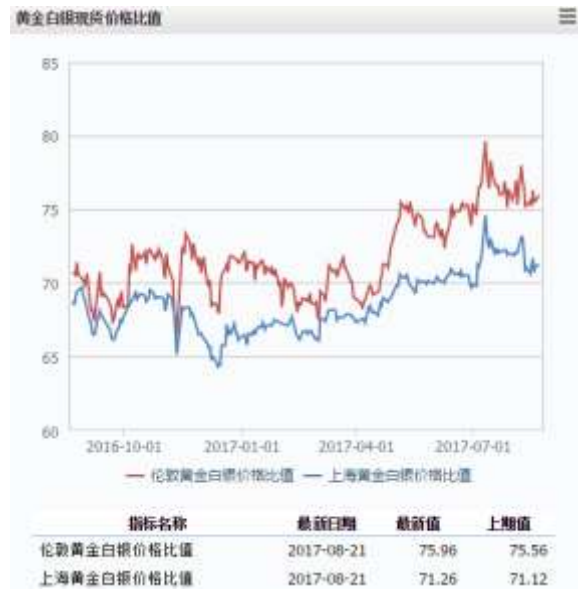
图 2 黄金白银现货价格比值