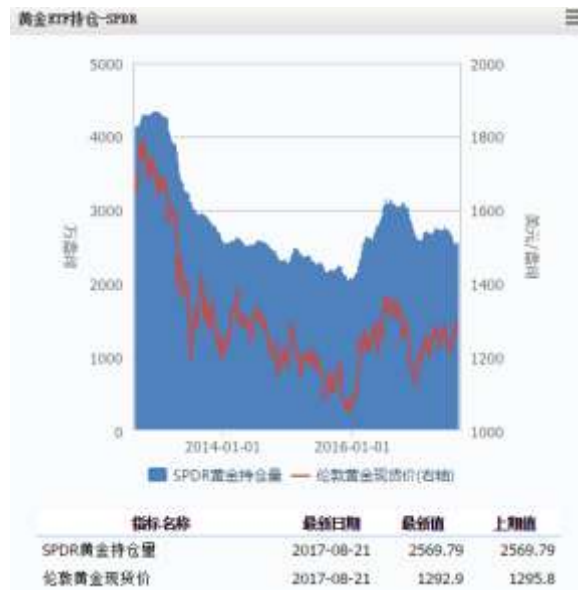
图 4 黄金 ETF-SPDR 持仓