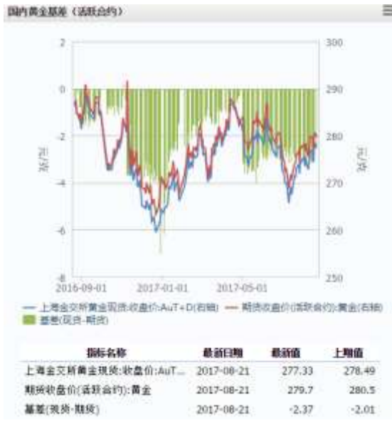
图 1 国内黄金基差