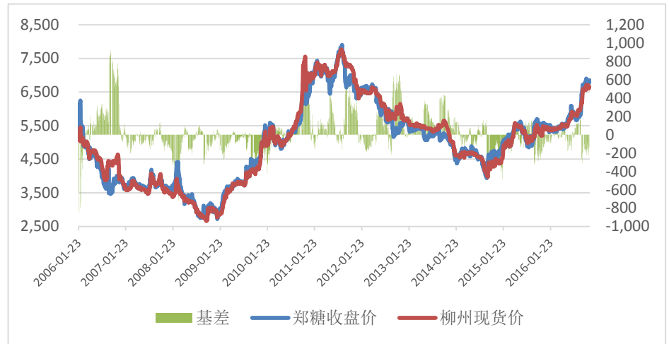
图 1.国内白糖基差（活跃合约）