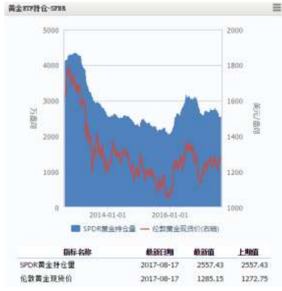
图 4 黄金 ETF-SPDR 持仓