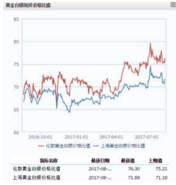
图 2 黄金白银现货价格比值