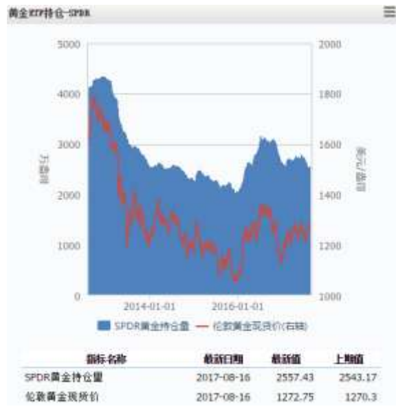
图 4 黄金 ETF-SPDR 持仓