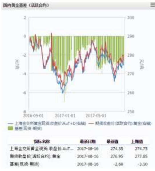
图 1 国内黄金基差