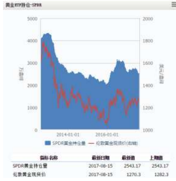
图 4 黄金 ETF-SPDR 持仓