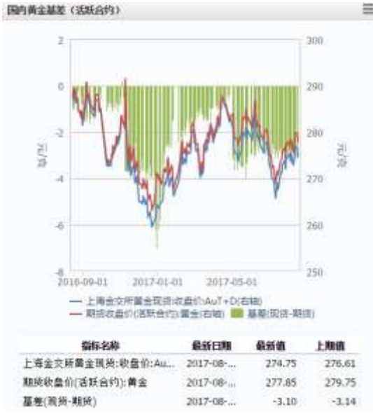
图 1 国内黄金基差