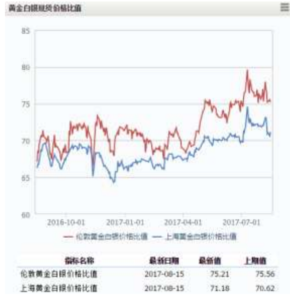
图 2 黄金白银现货价格比值