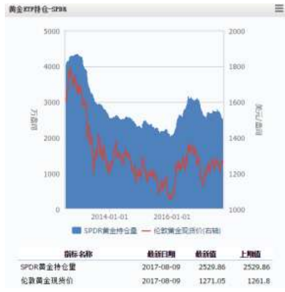
图 4 黄金 ETF-SPDR 持仓