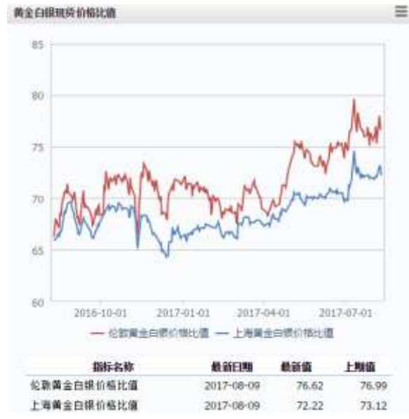
图 2 黄金白银现货价格比值