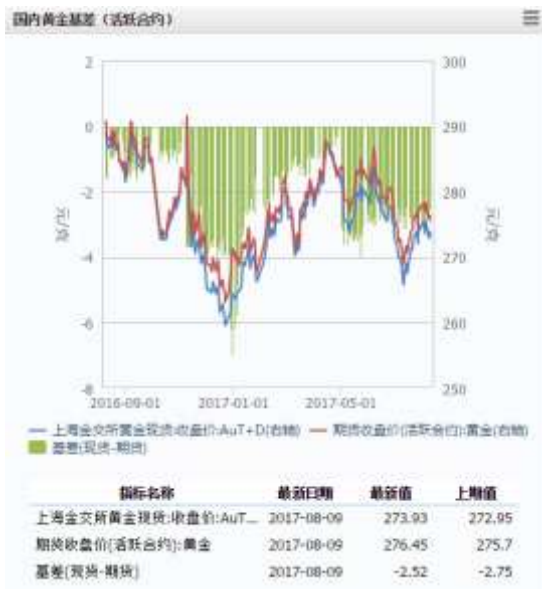
图 1 国内黄金基差