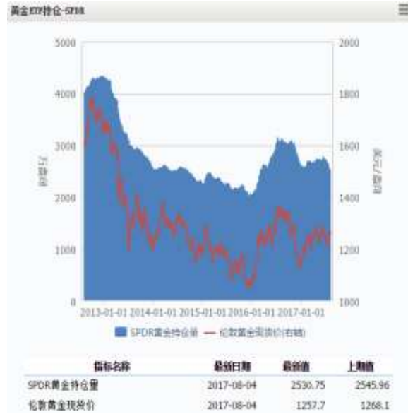
图 4 黄金 ETF-SPDR 持仓