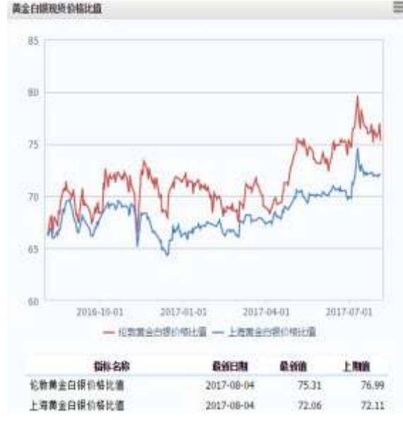
图 2 黄金白银现货价格比值