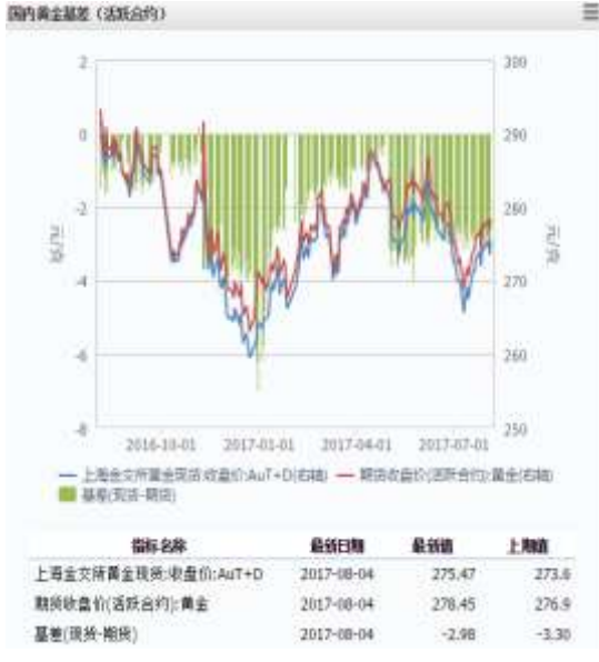
图 1 国内黄金基差