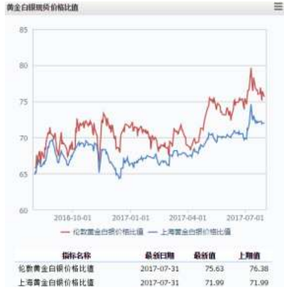
图2 黄金白银现货价格比值