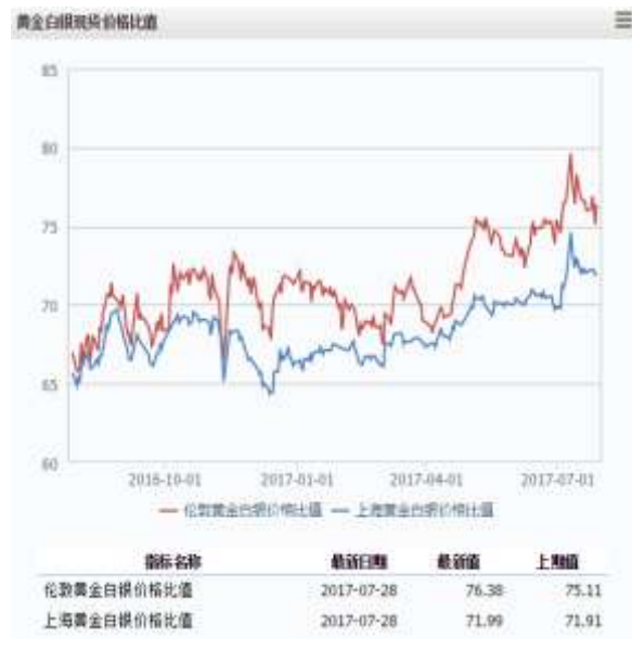
图 2 黄金白银现货价格比值