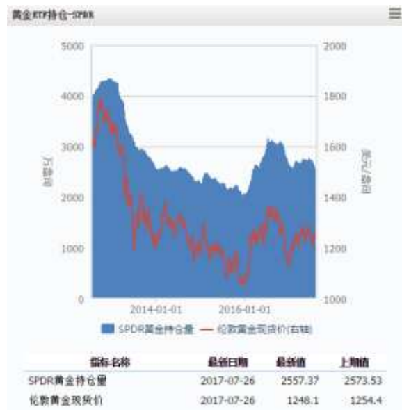
图 4 黄金 ETF-SPDR 持仓