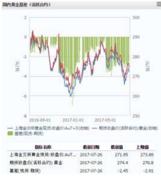
图 1 国内黄金基差