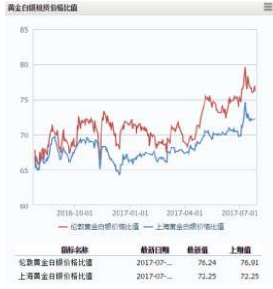
图 2 黄金白银现货价格比值