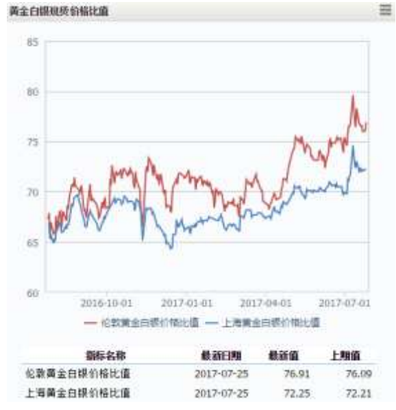
图 2 黄金白银现货价格比值