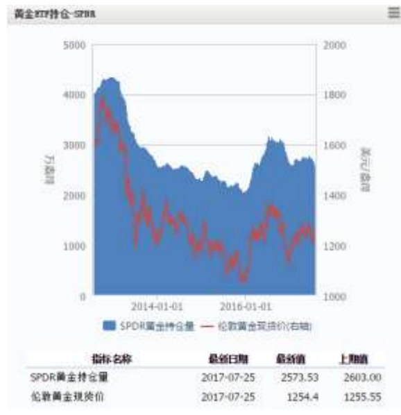
图 4 黄金 ETF-SPDR 持仓