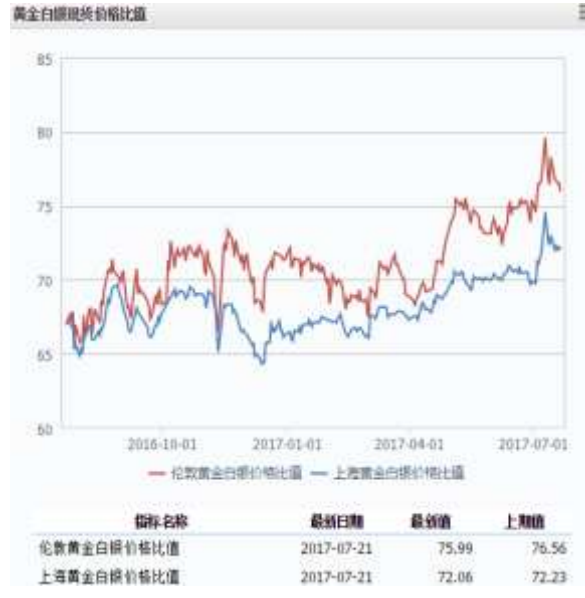
图 2 黄金白银现货价格比值