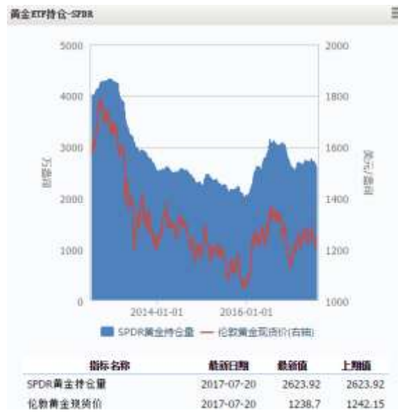
图 4 黄金 ETF-SPDR 持仓