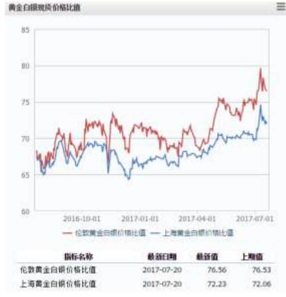
图 2 黄金白银现货价格比值