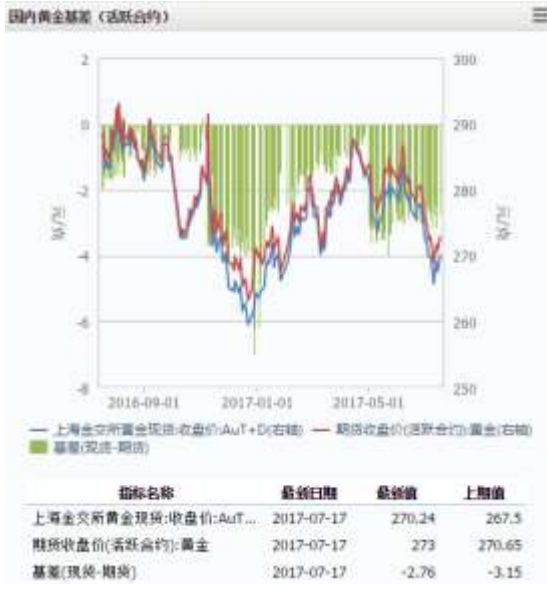
图 1 国内黄金基差