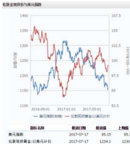
图 3 伦敦金现货价与美元指数