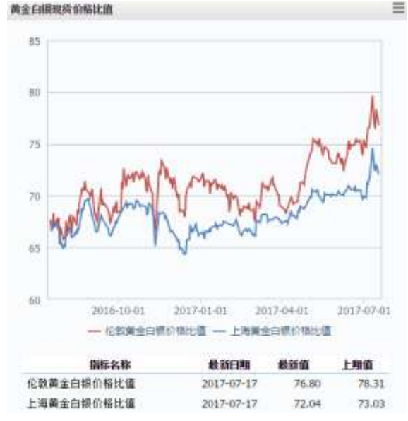
图 2 黄金白银现货价格比值