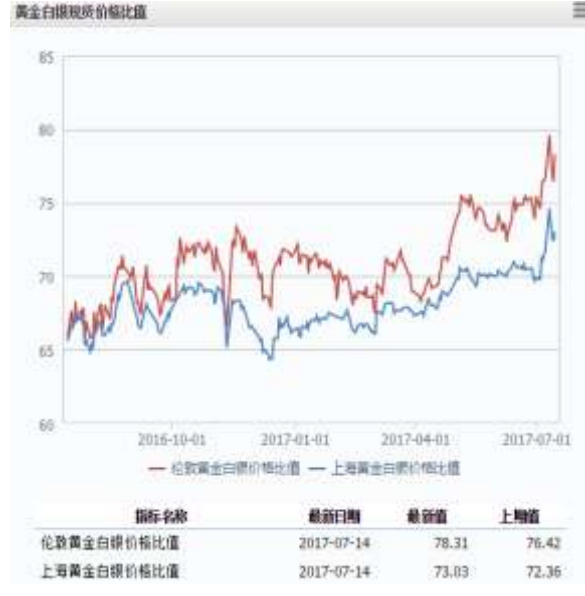
图 2 黄金白银现货价格比值