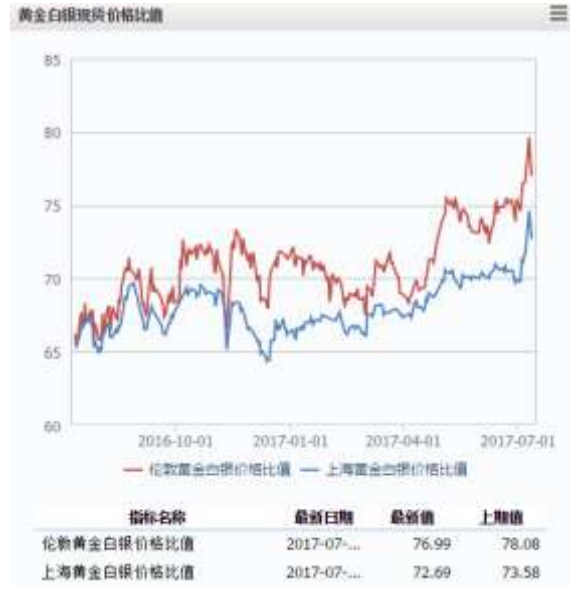
图 2 黄金白银现货价格比值