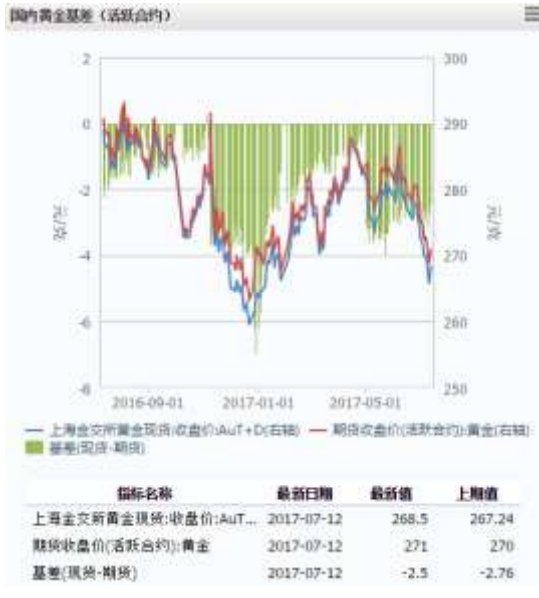
图 1 国内黄金基差