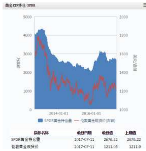
图 4 黄金 ETF-SPDR 持仓