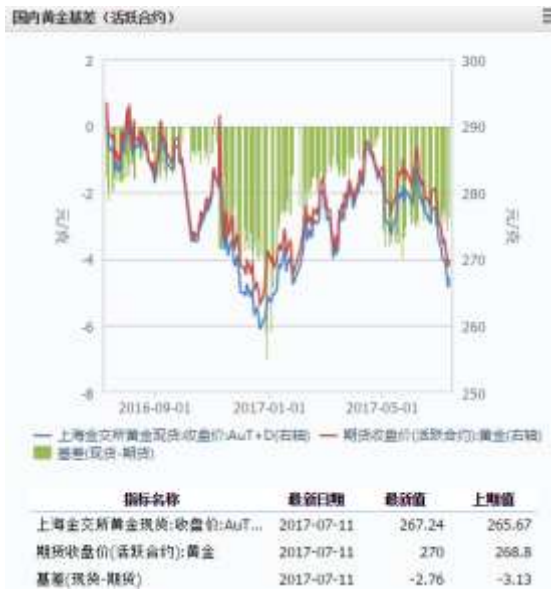
图 1 国内黄金基差