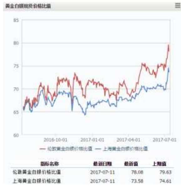
图 2 黄金白银现货价格比值