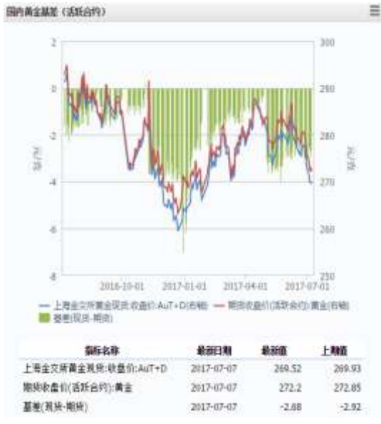
图 1 国内黄金基差