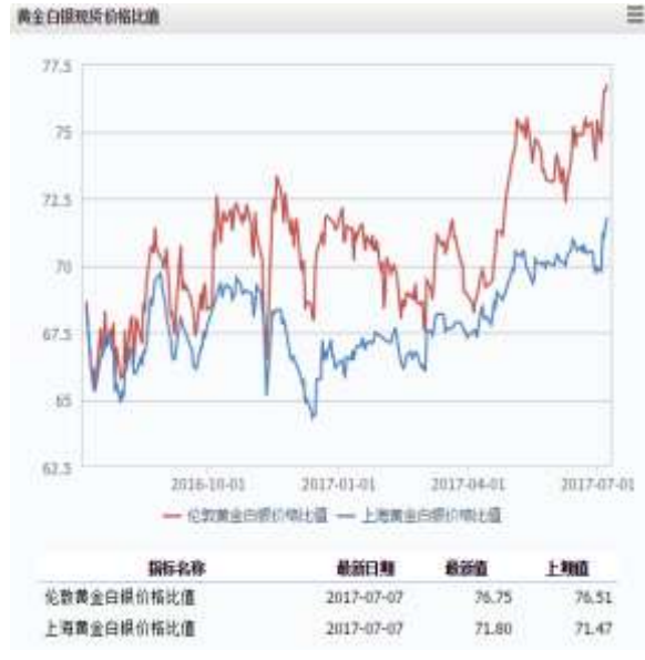
图 2 黄金白银现货价格比值