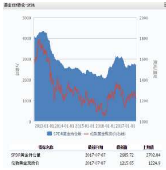
图 4 黄金 ETF-SPDR 持仓