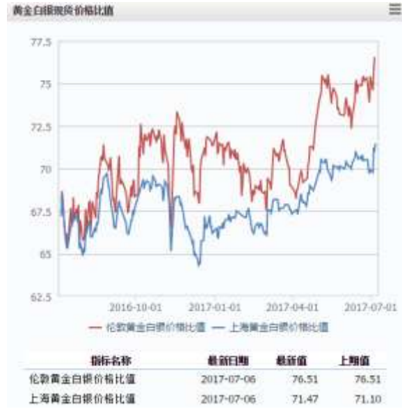
图 2 黄金白银现货价格比值