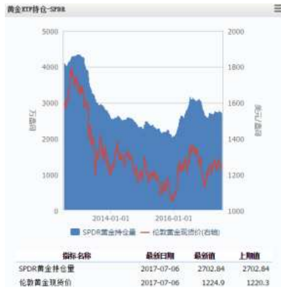
图 4 黄金 ETF-SPDR 持仓