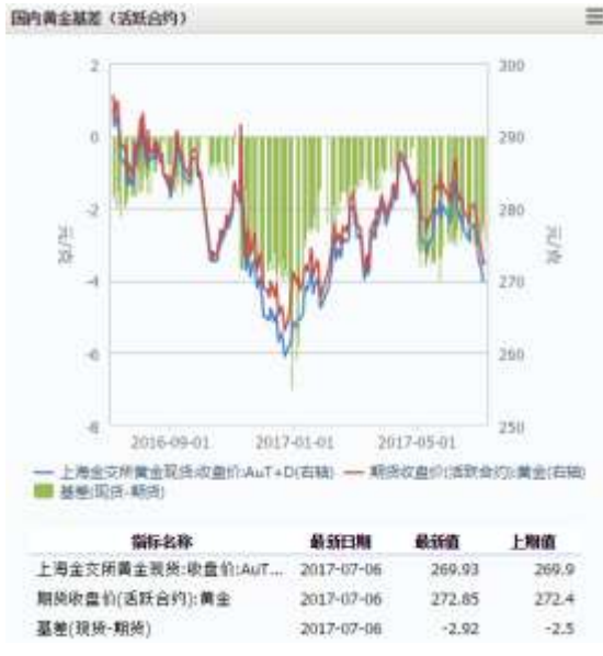
图 1 国内黄金基差